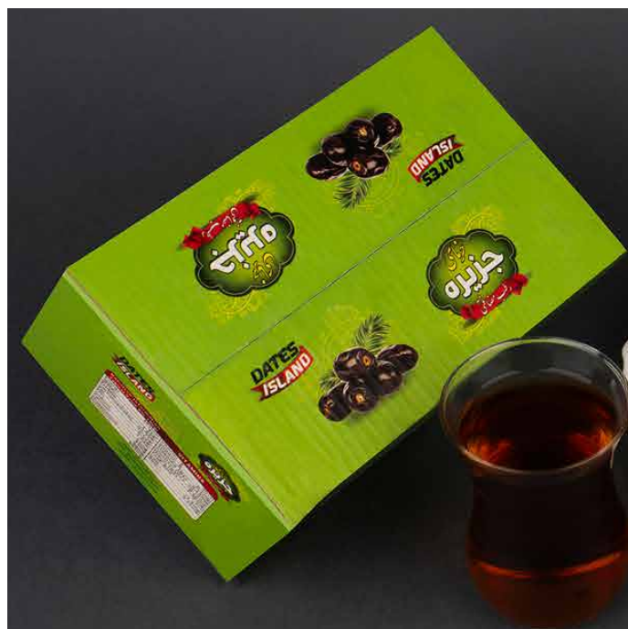
بعد از ادیت

عکس محصول تنها یک تصویر ساده از محصول روی پس‌زمینه سفید نیست؛ بلکه بخش مهمی از یک عکس حرفه‌ای و باکیفیت، به ویرایش دقیق آن توسط طراحان و متخصصان گرافیک بستگی دارد. ادیت‌های اصولی و تخصصی، باعث نمایش بهتر جزئیات و ویژگی‌های محصول می‌شوند و نقش کلیدی در تأثیرگذاری نهایی عکس ایفا می‌کنند. حذف لکه‌ها، خرابی‌ها، زدگی و شکستگی‌ها، اصلاح رنگ و نور، سایه زنی و تغییر هایلایت و سایه‌ها و... تنها بخشی از مراحل چندگانه ادیت و طراحی یک عکس محصول حرفه‌ایست.