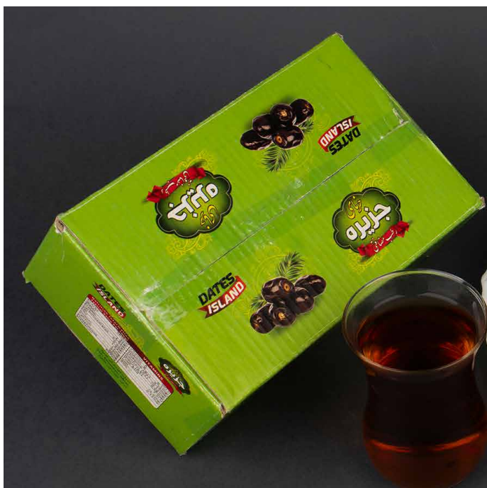
قبل از ادیت